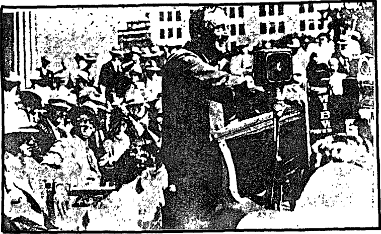
فرانكلين يتحدث في الجماهير

فقد كان يقول لشعبه في أثناء الانتخابات: «قبل كل شيء فإنني أود أن أؤكد اعتقادي الثابت بأن الشيء الوحيد الذي يجب أن نخافه هو الخوف ذاته!».